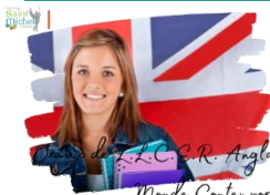
L.L.C.E.R. Anglais, Monde Contemporain

Des oraux auront lieu les lundi 27 et mardi 28 mai 2024 en salle 114 pour les élèves de 1°B et 1°C suivant l'enseignement de spécialité Anglais Monde Contemporain. Les horaires ont été communiqués aux élèves en début de semaine.