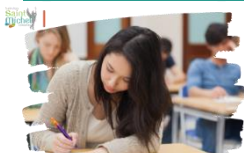
Épreuves anticipées de français

Les convocations pour les épreuves écrite et orale de français ont été publiées sur le compte Cyclades de l'élève ce vendredi 17 mai 2024 . Les familles ont normalement été destinataires d'un mail généré par la plateforme Cyclades leur indiquant qu'un nouveau document avait été publié. Une version papier de cette dernière a été remise aux élèves en heure de vie de classe ce jeudi 23 mai 2024.