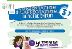
Affectation dans un établissement public

Conformément à l'article paru dans le St Michel hebdo n°27 intitulé « préparer l'après 3° », les familles qui en ont fait la demande ont reçu le document permettant d'effectuer la saisie en ligne des vœux d'affectation dans un établissement public pour la rentrée prochaine.