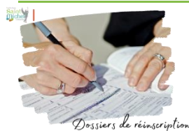
Dossiers de réinscription

Les dossiers de réinscription ont été remis cette semaine aux élèves de 4 o et de 3 o .