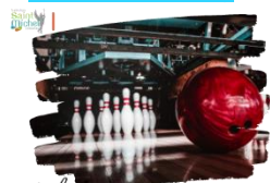
Sortie bowling & Laser Game à Caudry

Jeudi 23 mai 2024 , les internes ont participé à leur sortie de fin d'année, Bowling pour les collégiens et Laser Game pour les lycéens à Caudry. Bravo aux gagnants de chaque partie ! L'ambiance était très conviviale.