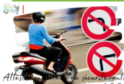
Attestation de sécurité routière ASSR2

Comme annoncé dans le St Michel hebdo n°18 de février dernier , l'attestation scolaire de sécurité routière niveau 2 concerne les élèves de 3° mais aussi les élèves d'autres classes qui atteignent l'âge de 16 ans au cours de l'année civile ainsi que les élèves âgés de plus de 16 ans qui n'en sont pas titulaires.