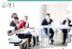
Conseils de classe

À noter : Les élèves délégués de 2° ne sont pas conviés. Les parents correspondants participent aux conseils de classe de 2°. Ils ont reçu le mardi 21 mai 2024 par mail les informations ( lettre invitation et compte rendu du conseil de classe ).