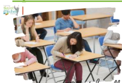
Brevet des collèges

Les deux matières retenues par le ministère pour l'épreuve de science sont :