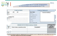
Affectation post 2°

Les élèves demandant une affectation en voie technologique ou professionnelle et sollicitant un doublement dans un établissement public ou agricole pour l'année scolaire 2024 / 2025 ont reçu une annexe à compléter et signer par les 2 responsables légaux. Le document est à rendre pour le lundi 27 mai 2024.