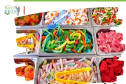
Ventes de friandises et de boissons

À partir de ce lundi 27 mai 2024 , des friandises et des boissons (de 0,50€ à 1,50€) seront en vente, dans la cour du collège, lors des récréations du matin et de l'après-midi .