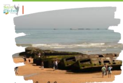
Plages du débarquement en Normandie

Une réunion d'information relative au séjour en Normandie prévu du lundi 10 au mercredi 12 juin 2024 se déroulera le mardi 04 juin 2024 à 18h00 en salle St Gabriel. Parents et élèves sont invités à y participer pour obtenir tous les renseignements utiles et poser d'éventuelles questions.