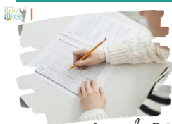
Examen du B.I.A.

Les épreuves écrites du B.I.A. se dérouleront le jeudi 30 mai 2024 de 14h00 à 17h30 (épreuve obligatoire suivie de l'épreuve d'anglais).