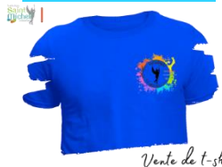
Vente de t-shirt

Une vente de T-shirts est proposée aux élèves internes. Celui-ci sera de couleur bleue avec le logo de l'internat et au dos le prénom de l'élève, le prix est de 10 euros.