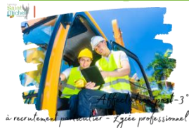
à recrutement particulier - Lycée professionnel

Les demandes d'affectation commenceront pour la plupart courant mai 2024 . Cependant certaines formations post-3° professionnelles fonctionnent par des recrutements avec dossier de validation auxquels les familles doivent inscrire leur enfant dans les plus brefs délais.