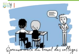
Epreuve orale du brevet des collèges

Cette épreuve obligatoire se déroulera le mardi 21 mai 2024 au sein de l'Institution St Michel .