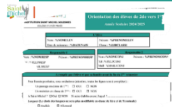
Fiches d'orientation 2° vers 1°

Les élèves de 2° ont reçu le vendredi 19 avril 2024 une fiche d'orientation pour l'année scolaire prochaine.