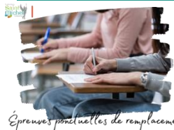
Épreuves ponctuelles de remplacement

Dans le cadre de la mise en place du contrôle continu dans les épreuves du baccalauréat, une convocation aux épreuves ponctuelles de remplacement sera adressée la semaine prochaine aux familles des élèves dont la moyenne est jugée « non significative » par les enseignants via la messagerie École Directe .