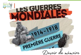
Devoir de mémoire

Une sortie au musée de Flandre de Cassel et à La Coupole d'Helfaut-Wizernes, un bunker de la Seconde Guerre mondiale, aujourd'hui centre d'histoire et de mémoire, situé dans la commune d'Helfaut, près de Saint-Omer est programmée le vendredi 24 mai 2024 (départ 08h00 et retour vers 18h30) .