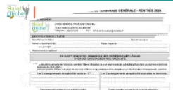
Choix des enseignements de spécialité poursuivis en classe de T°

La législation en vigueur concernant les épreuves du baccalauréat impose qu'un élève abandonne en fin de 1° l'un des trois enseignements de spécialité qu'il/elle suit actuellement.