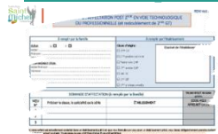
Affectation post 2°

→ Les élèves de 2° qui sollicitent une inscription en 1° générale dans un établissement public ;