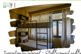
Inscription en internat - Établissement public

Attention : les inscriptions en internat dans un établissement public nécessitent de monter un dossier. Pour l'obtenir, merci de prendre contact avec Mme DUEZ via la messagerie École Directe. Ce dossier dûment complété est à déposer à son bureau pour le lundi 13 mai 2024 avec les pièces complémentaires demandées.