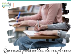
Épreuves ponctuelles de remplacement

Dans le cadre de la mise en place du contrôle continu dans les épreuves du baccalauréat, une convocation aux épreuves ponctuelles de remplacement sera adressée la semaine prochaine aux familles des élèves dont la moyenne est jugée « non significative » par les enseignants via la messagerie École Directe .