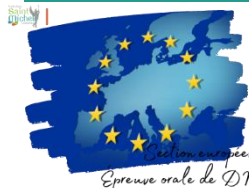
Section européenne Épreuve orale de DNL

L'épreuve orale spécifique de discipline non linguistique histoire-géographie dans le cadre de la scolarité en section européenne se déroulera le mardi 14 mai 2024 pour l'anglais et le mardi 21 mai 2024 pour l'allemand .