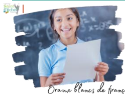
Oraux blancs de français

Pour rappel, la deuxième série d'oraux blancs de français se déroulera du mardi 21 au vendredi 24 mai 2024 .