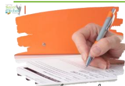
Fiche navette d'orientation

Les fiches navettes d'orientation ont été remises aux élèves cette semaine en heure de vie de classe. Elles portent l'appréciation du conseil de classe sur l'orientation demandée par la famille. C'est maintenant le cadre 3 que les familles sont invitées à compléter ( vœux définitifs classés dans l'ordre de préférence et l'établissement choisi ) et à signer par les deux représentants légaux.