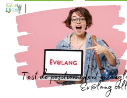
Test de positionnement en anglais Ev@lang collège

L'épreuve initialement prévue le lundi 25 mars 2024 est reportée au jeudi 04 avril 2024 à 09h30. Rendez-vous en salle informatique.