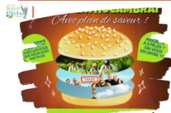
Offre Maxi Best Of Jeunes Cathocambrai

Parce que quand on aime on ne compte pas, et que quand on aime le Seigneur, on ne peut pas faire le tri !