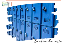
Location du casier

Le chèque pour la location du casier de votre enfant 26,00 euros sera débité la semaine du lundi 29 janvier au vendredi 02 février 2024.