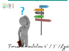
Forum d'orientation 4° / 3° / 2°

Les élèves de 1° se rendront au forum d'orientation organisé le mercredi 22 novembre 2023 de 13h40 à 15h10 à la salle Édouard Delberghe de Solesmes. Ils peuvent d'ores et déjà consulter sur leur panneau d'affichage la liste des écoles présentes afin de préparer leur visite. Des plaquettes de présentation seront disponibles sur la plupart des stands.