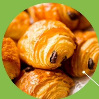
Petit pain au beurre

Tous les lundis , mardis , jeudis et vendredis pendant la récréation à l'entrée du self