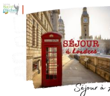
Séjour à Londres

Pour rappel, les élèves participant au séjour à Londres du mercredi 21 au vendredi 23 février 2024 doivent fournir les documents suivants sous enveloppe à M. MIGALSKI au plus tard le vendredi 15 décembre 2023 :