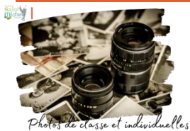
Photos de classe et individuelles

Les photos de classe ont été montrées aux élèves collégiens et lycéens ce vendredi 06 octobre 2023 en heure de vie de classe (pour rappel, le prestataire ne fournit pas un aperçu de la photo comme cela était le cas les années précédentes, par contre il vous fait bénéficier d'un tarif plus avantageux).