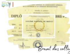
Brevet des collèges

Malgré les articles du Saint Michel hebdo, les rappels oraux et par voie d'affichage sur le panneau 3°, certains élèves n'ont toujours pas remis les documents nécessaires à l'inscription aux examens du brevet des collèges.