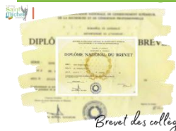
Brevet des collèges

Les épreuves écrites du brevet des collèges se dérouleront les lundi 1 er et mardi 02 juillet 2024. La session de remplacement ( envisageable sous certaines conditions ) se déroulera les jeudi 19 et vendredi 20 septembre 2024.