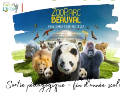
Sortie pédagogique - fin d'année scolaire

La date limite des inscriptions à la sortie de 3 jours au zoo de Beauval et au château de Cheverny proposée aux élèves de 4° du lundi 10 au mercredi 12 juin 2024 est fixée au lundi 09 octobre 2023 dernier délai . Au-delà de cette date, plus aucune inscription ne pourra être acceptée.