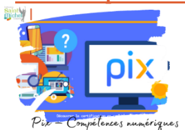
Pix – Compétences numériques

Pour quoi faire ? Fournir aux élèves une attestation qui valide officiellement le niveau de leurs compétences numériques. Pix s'adresse à tous les élèves de la 5° à la T° (des tests sont en attente pour les 6° ).