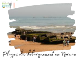
Plages du débarquement en Normandie

Le chèque de 100 euros déjà remis à Mme DUEZ ( pour rappel il est non-remboursable en cas de désistement ) sera prélevé à compter du vendredi 20 octobre 2023 .