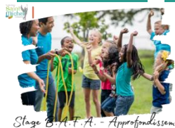
Stage B.A.F.A. - Approfondissement

Un stage B.A.F.A. - Approfondissement avec internat se déroulera à Saint Michel durant les prochaines vacances de Toussaint, du lundi 23 octobre à 10h00 au samedi 28 octobre 2023 à 16h00. Il est accessible à tout élève à partir de 16 ans* qui a suivi la formation de base ( celle organisée à l'institution du samedi 22 au samedi 29 avril 2023 ou dans un autre centre ).