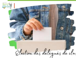
Election des délégués de classe

Les élections des délégués et éco-délégués se dérouleront le vendredi 13 octobre 2023 en heure de vie de classe.