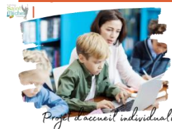
Projet d'accueil individualisé

Les élèves atteints de troubles de la santé qui évoluent sur une longue période et/ou qui peuvent donner lieu à des aménagements au quotidien, et/ou pour les examens, doivent faire l'objet d'un P.A.I.