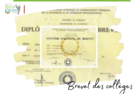
Brevet des collèges

En prévision de l'inscription aux examens du brevet des collèges, nous invitons les élèves de 3° à vérifier que leur pièce d'identité (carte ou passeport) est en cours de validité et à en donner une copie imprimée SUR UNE FEUILLE FORMAT A4 non découpée à leur professeur principal au plus vite et avant la fin du mois de septembre 2023.