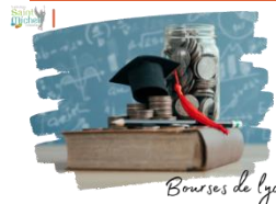
Bourses de lycée

Tout élève déjà scolarisé en lycée n'ayant jamais été boursier national de lycée ainsi que les élèves de 3 o passant en 2 o ( bousiers ou non en 2022/2023 ) peuvent déposer un dossier de demande de bourses nationales lycée .