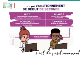
Test de positionnement

Les tests de positionnement se poursuivent la semaine prochaine selon le planning suivant :