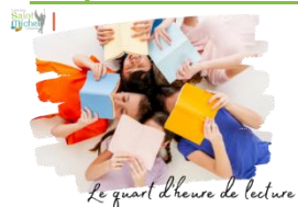
Le quart d'heure de lecture

Dans le cadre du quart d'heure de lecture, tous les élèves de 6° sont invités à choisir un livre et à l'apporter chaque mardi après-midi . Il peut s'agir d'un roman, d'un documentaire, d'une bande dessinée, l'élève peut se laisser guider par son envie de découvrir dans le respect des lois de la République. Ce temps de pause collectif en silence, outre ses vertus d'apaisement du climat scolaire, favorise la concentration des élèves et une immersion dans la lecture. Le quart d'heure achevé, l'univers de l'auteur continuera d'accompagner l'élève jusqu'à la prochaine séance.