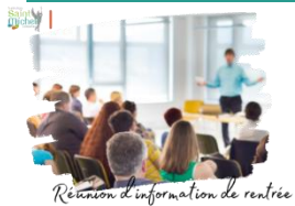
Réunion d'information de rentrée

Une réunion d'information pour les familles des élèves de 1° et T° avec les professeurs principaux se déroulera le lundi 25 septembre 2023 à partir de 18h15.