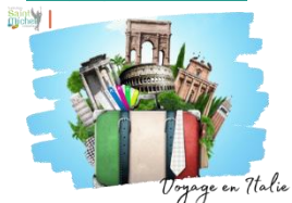
Voyage en Italie

Un voyage est organisé pour les élèves de T° en Italie du vendredi 19 au mercredi 24 avril 2024 (dates approximatives). Il se composera de plusieurs étapes :