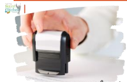
Certificat de scolarité

Deux certificats de scolarité ont été remis à chaque collégien et lycéen cette semaine.