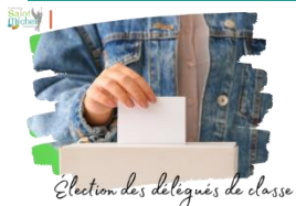
Election des délégués de classe

Lors de la prochaine heure vie de classe , le vendredi 22 septembre 2023 , auront lieu les élections des délégués de classe et des éco-délégués.