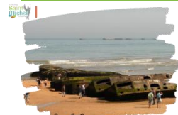
Plages du débarquement en Normandie

Une sortie de 3 jours en Normandie sur les plages du débarquement est programmée pour le mois de mai, voire juin 2024 (durant la période des commémorations du D-day) selon les disponibilités en termes d'hébergement. Afin de connaître l'effectif précis des élèves qui souhaitent y participer, nous procédons à une pré-inscription. Pour cela, nous vous invitons à compléter le coupon distribué aux 3° en heure de vie de classe ce vendredi 15 septembre 2023 et à le remettre à Mme DUEZ accompagné d'un chèque de 100 euros non remboursables qui vaut engagement.