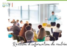
Réunion d'information de rentrée

La réunion d'information 3° s'est déroulée ce jeudi 14 septembre 2023 .