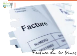
Facture du 1 er trimestre

Vous avez reçu par École Directe votre facture du 1 er trimestre 2023 / 2024.